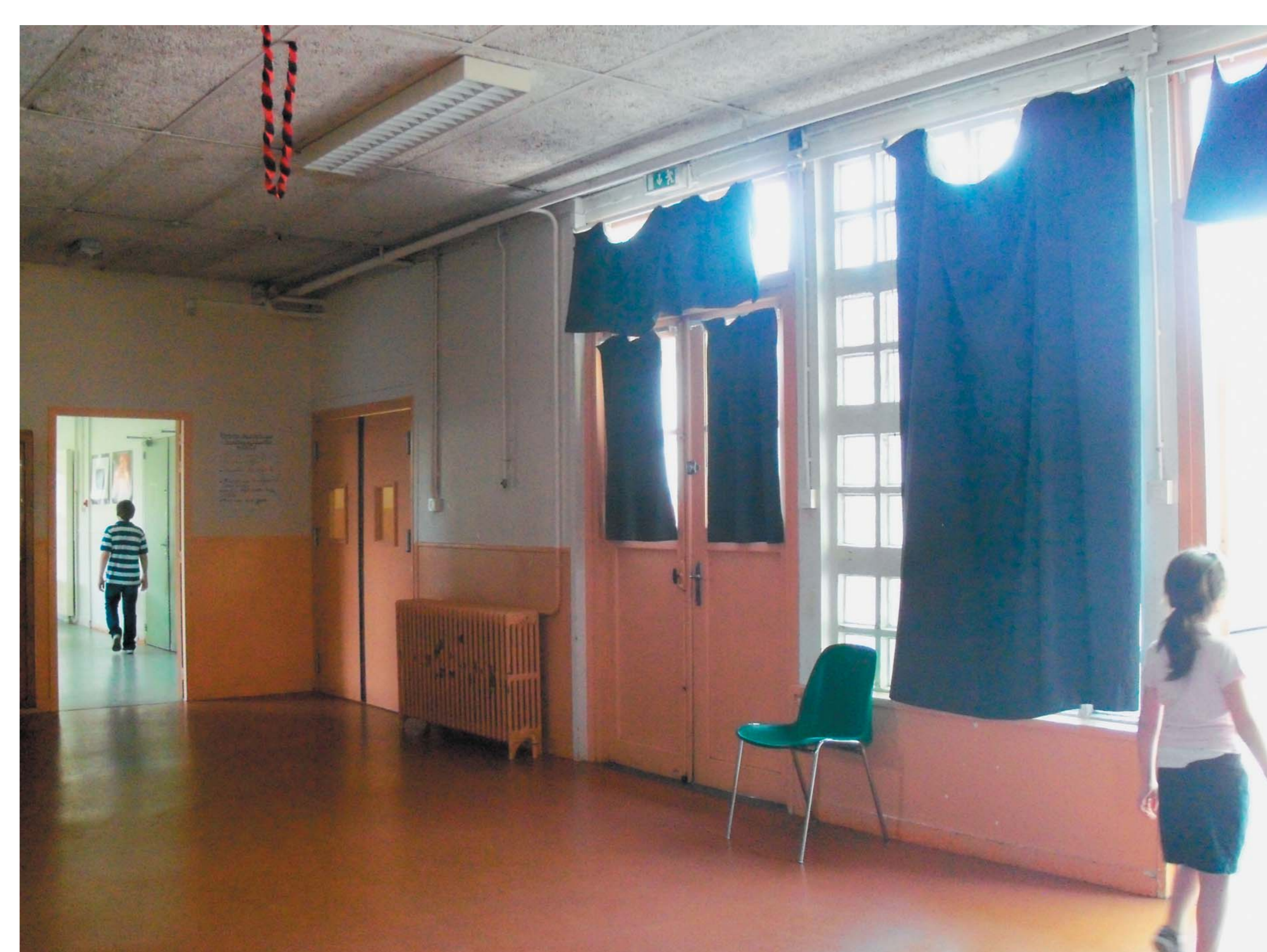
— Le préau