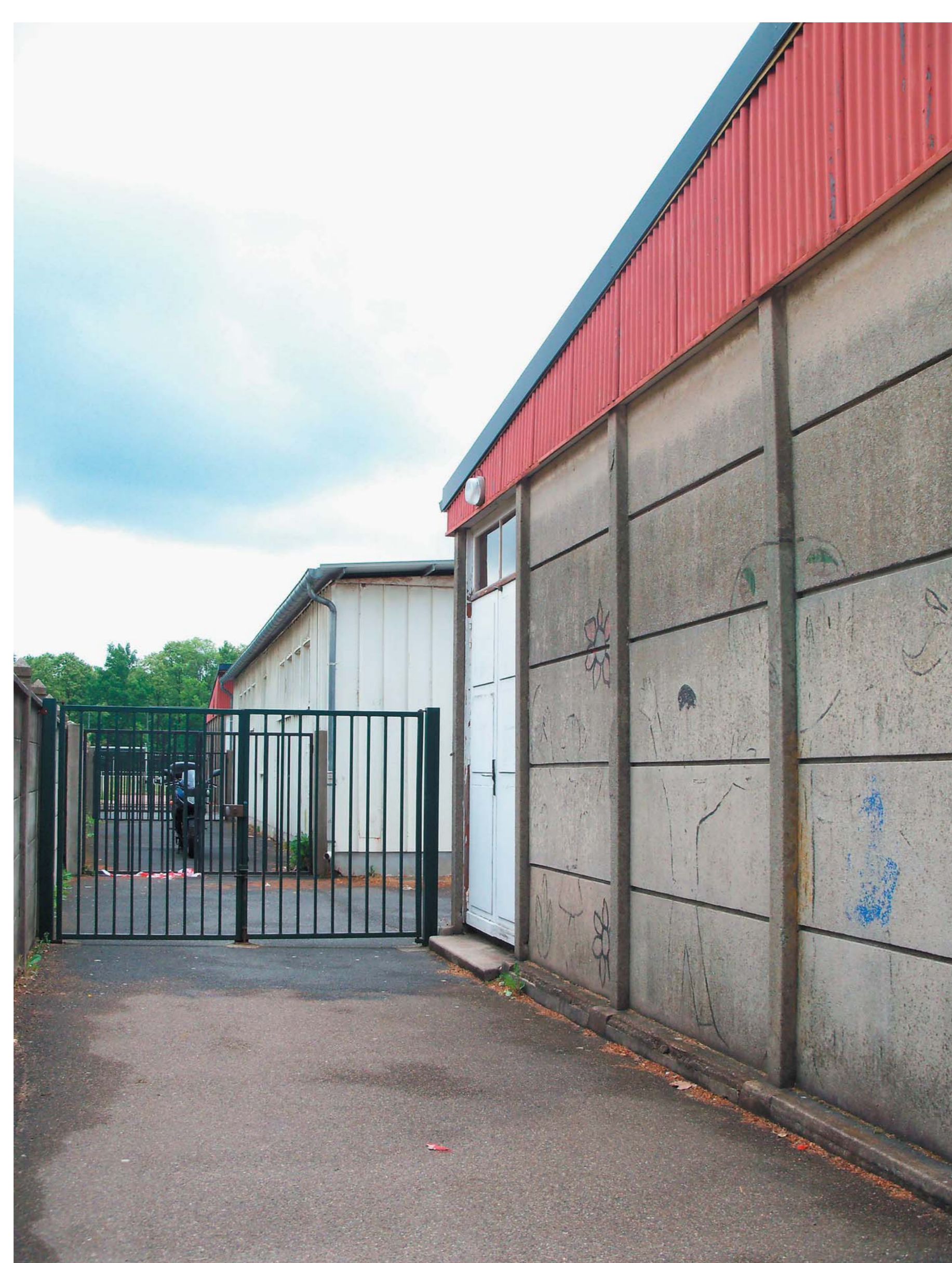
— L'entrée vue de près