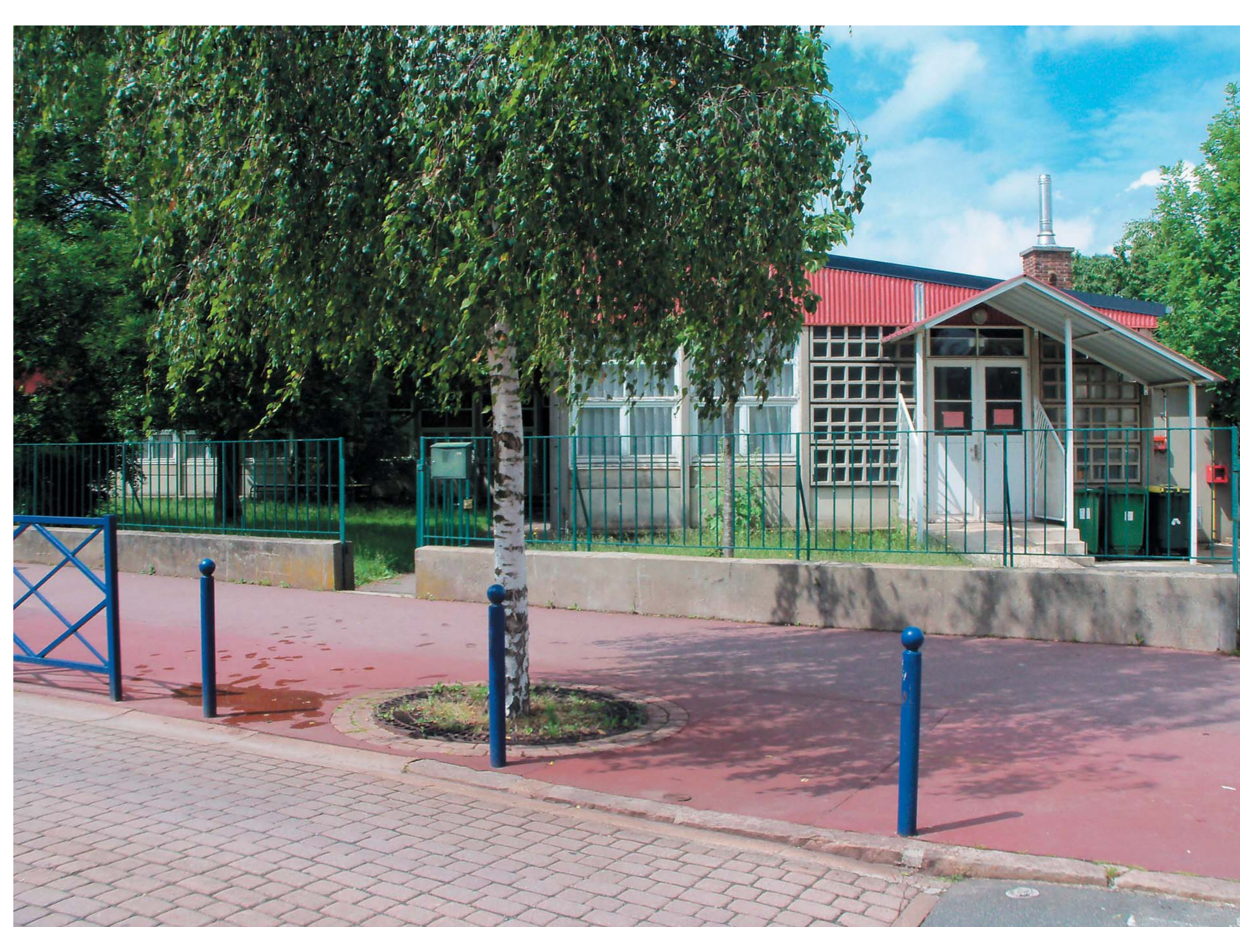
— Notre point fixe, l'école vue depuis la rue