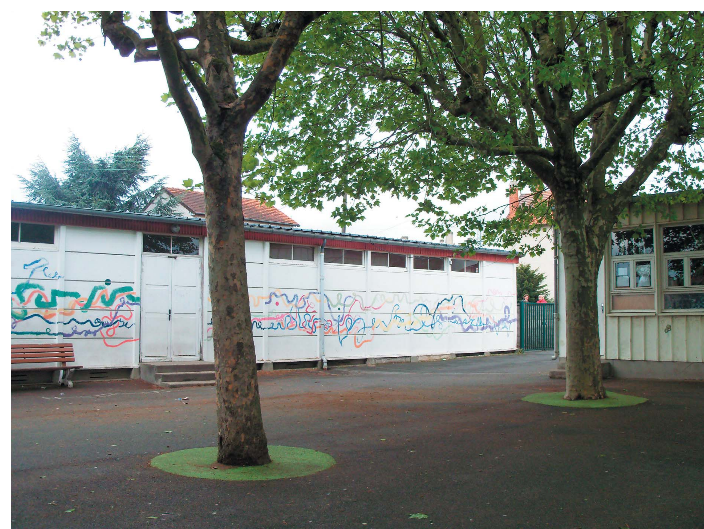
— La cour de récréation