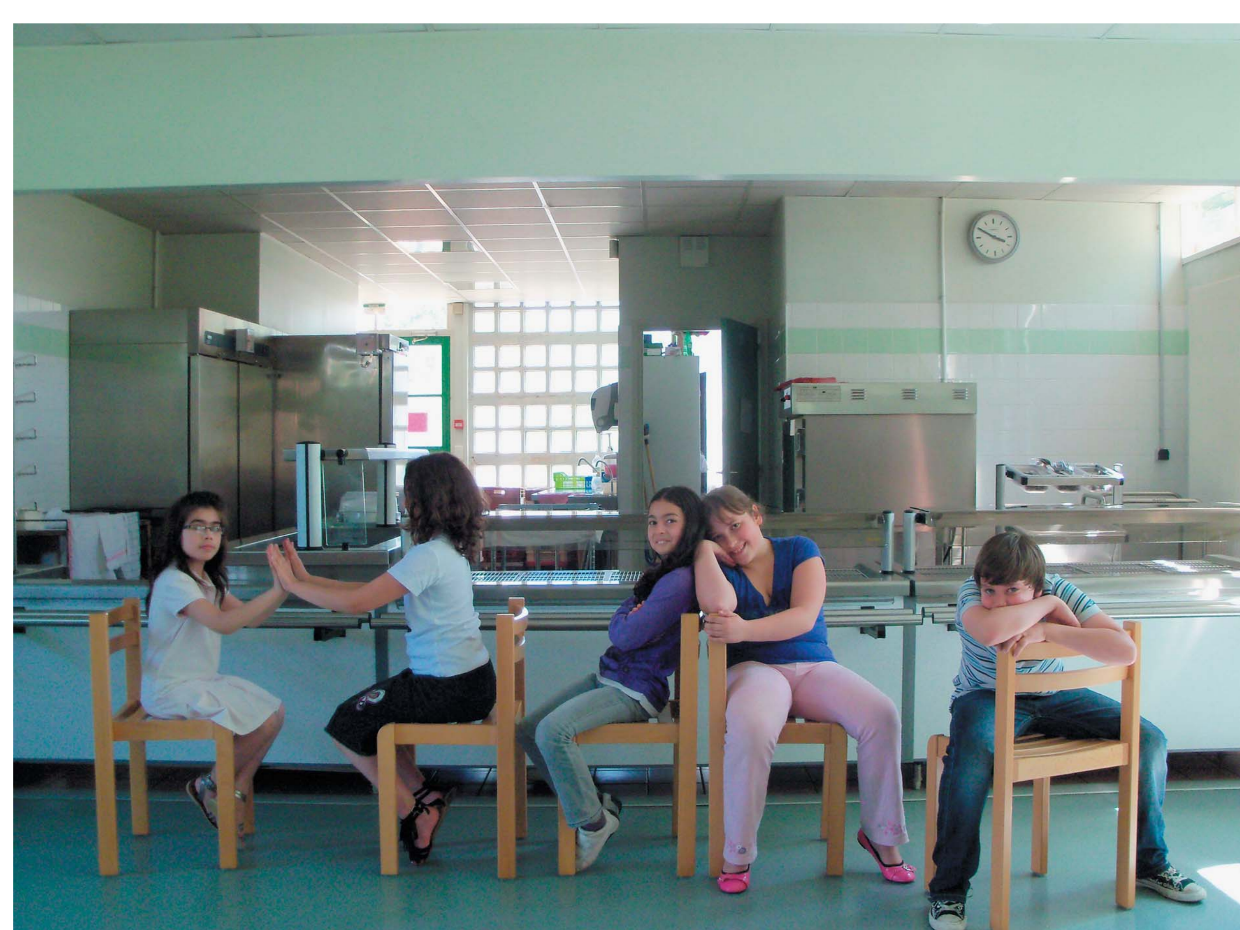
— Dans la cantine, devant la cuisine