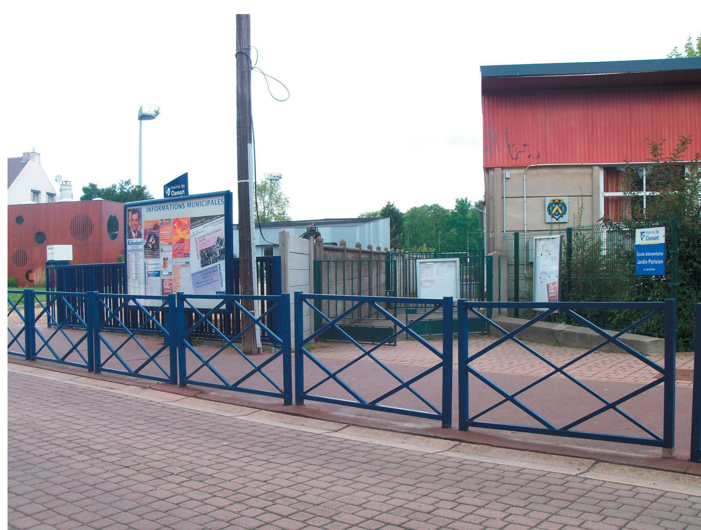
— Vue de l'entrée de l'école