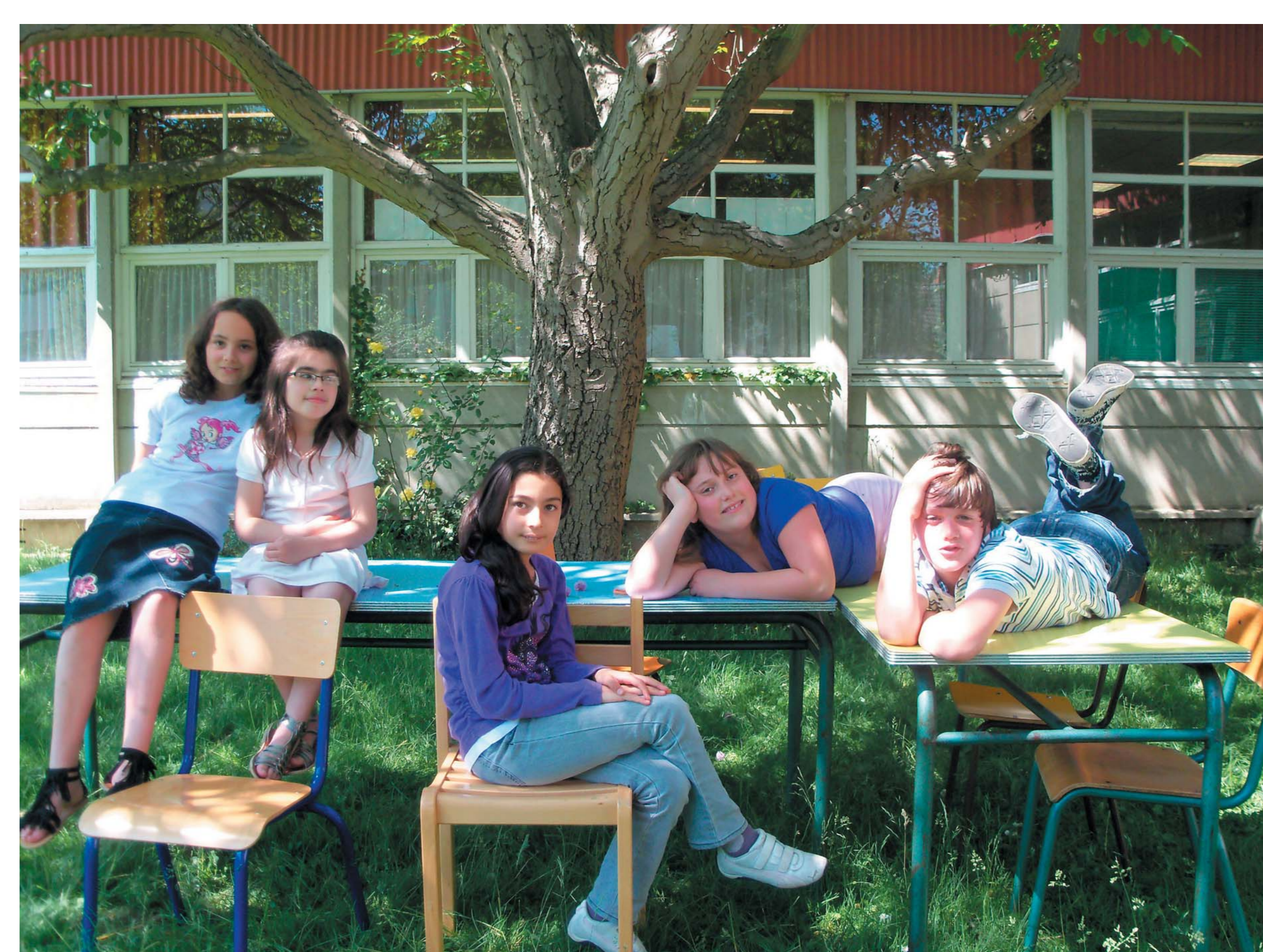
— Lieu où les enseignants mangent quand il fait beau