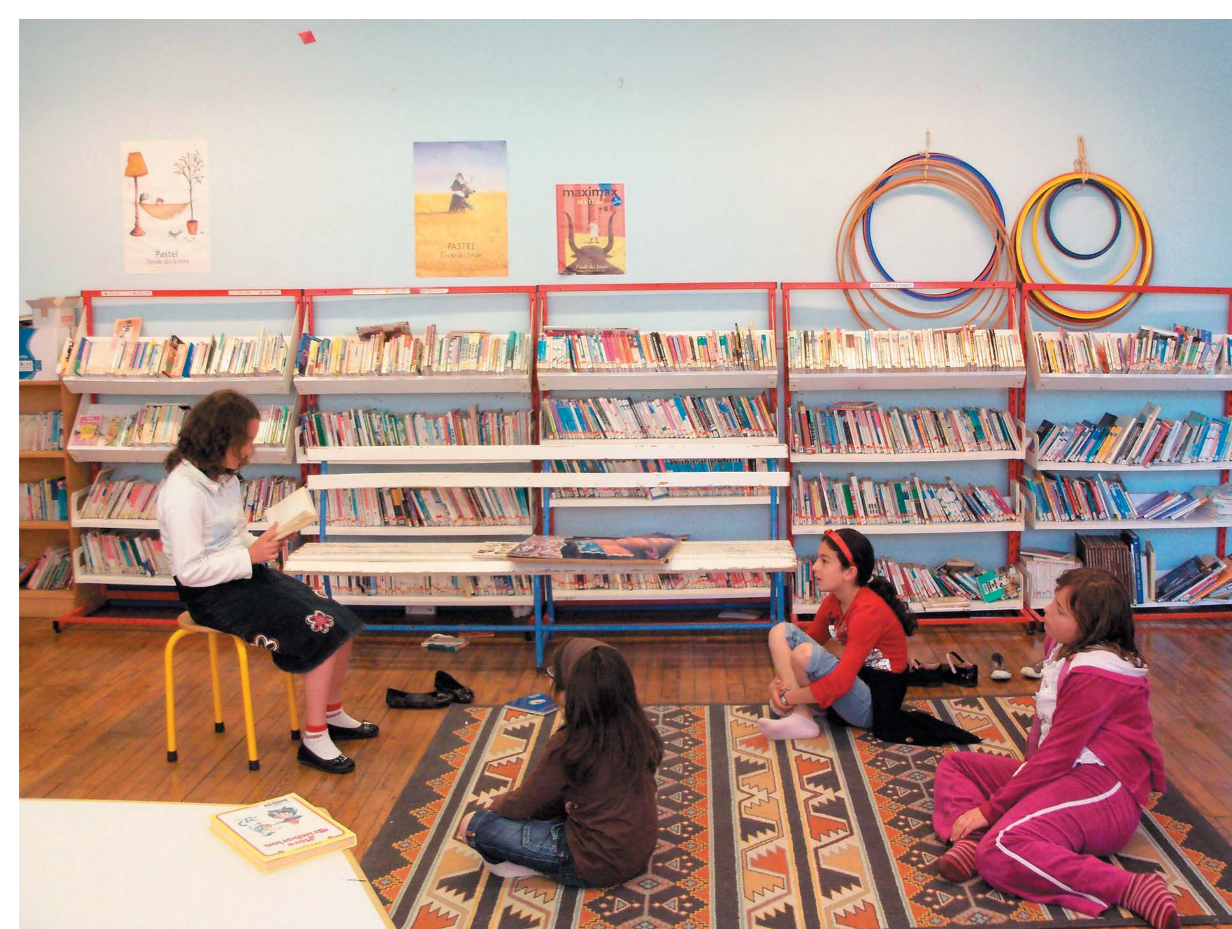
— La bibliothèque de l'école