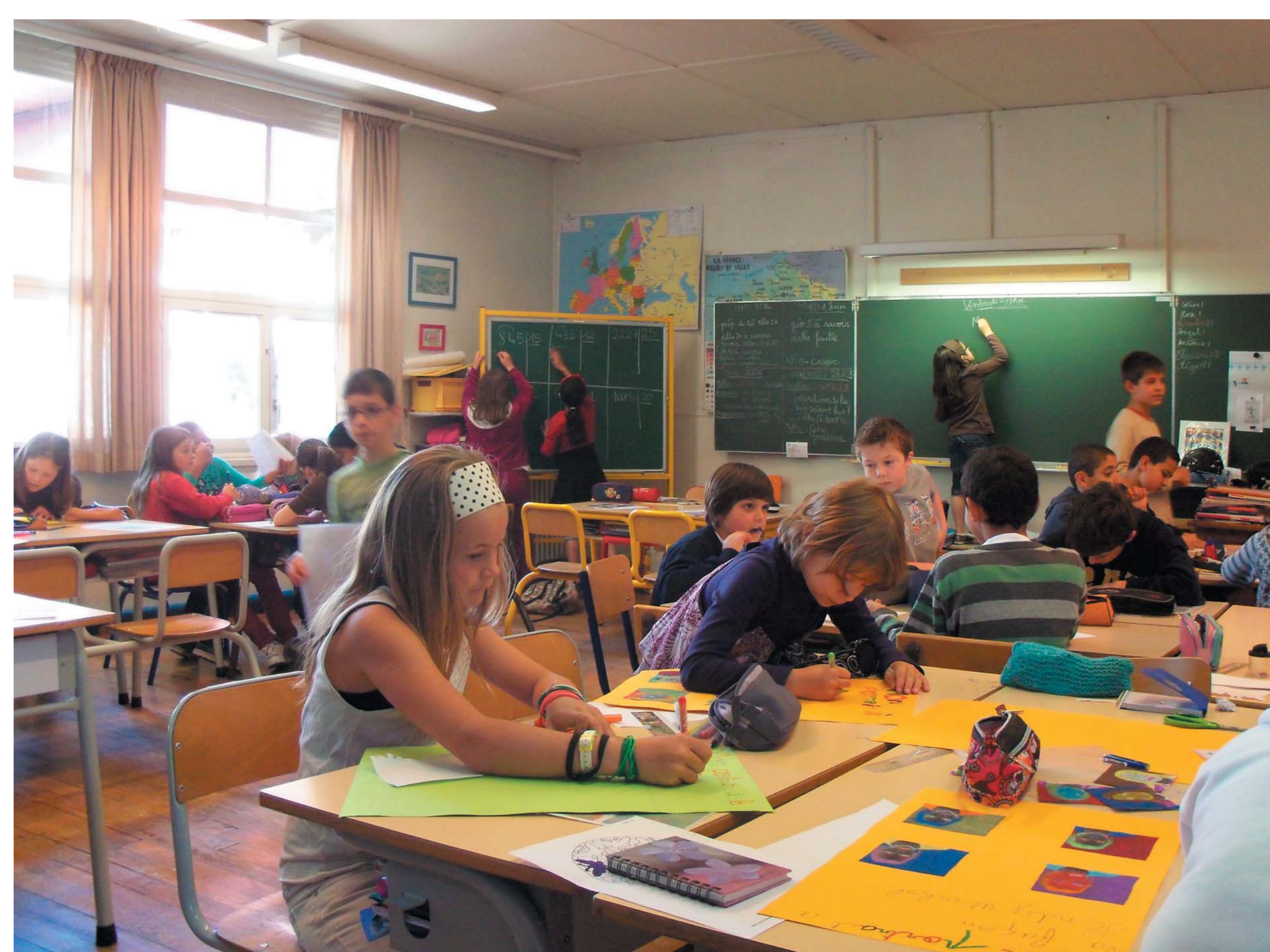
— Notre classe