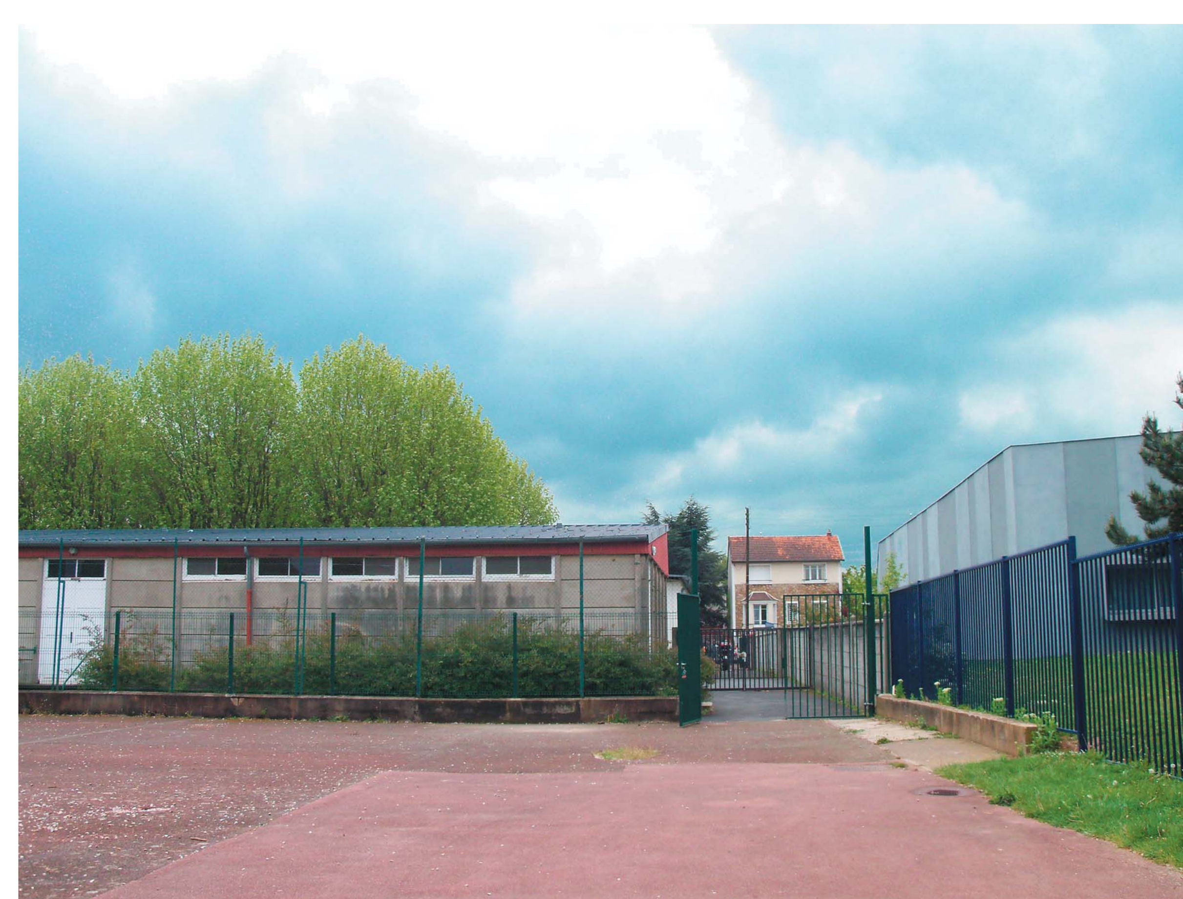
— L'entrée du stade